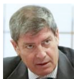
• DOMINGO LORENTE SECRETARIO GENERAL DEL CONSEJO GENERAL DE LOS COLEGIOS DE MEDIADORES DE SEGUROS